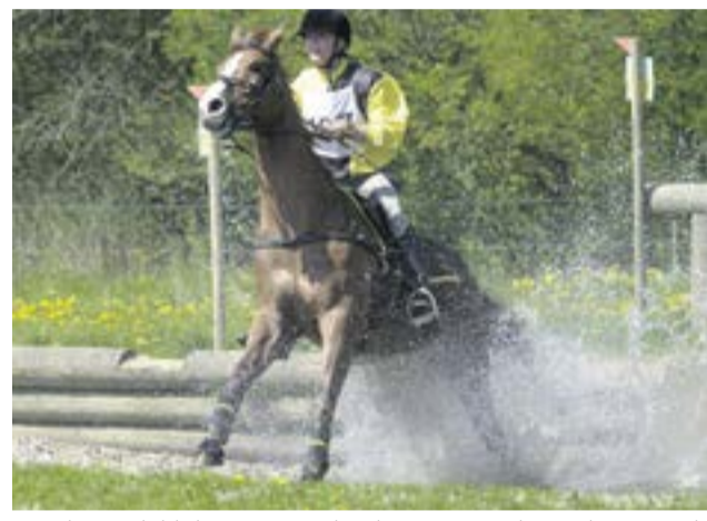
Vasehus Rideklub arrangerer landsstævne i military den 2. april.

18.00 Hammershøj og Omegns Jagtforening starter på hundedressur i terrænet ved Hammerfjeld. 19.00 Vejrumbro Vandværk holder generalforsamling i Vejrumbro Forsamlingshus. 19.30 Vammen Vandværk holder generalforsamling på Vammen Kro.