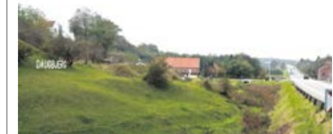
16 Daugbjerg-borgere er nu uddannet i brugen af byens nye hjerterstarter.

10.00-17.00 Åbent i Mønsted Kalkgruber 17.15 Fodboldtræningsstart fra U5,U6 og U7 på stadion i Mønsted. 19.00 Danseften på Fripøjehjemmet Nordstjernen, Sparkær