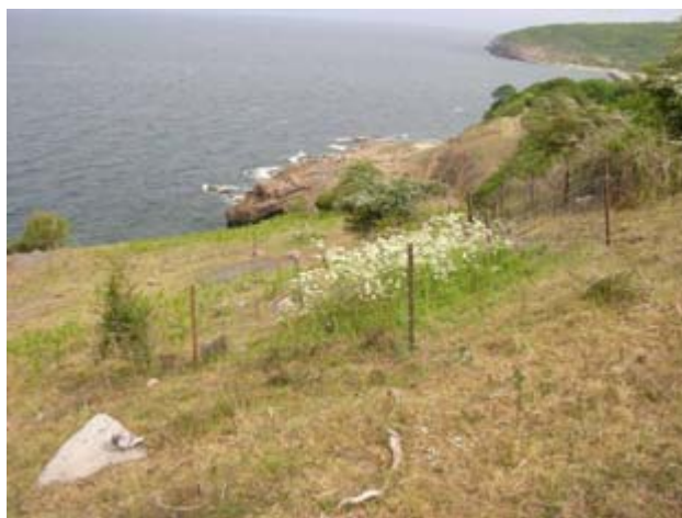
Vild kørvel ædt udenfor nulparceller