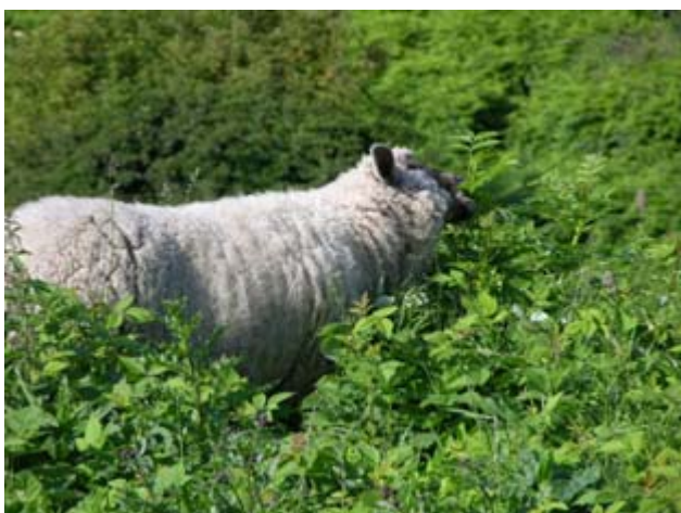
Får æder ask

Den store stygge ulv er nu Ørnebregne, som er giftig. Den er virkelig invasiv i nye rydninger. Det kræver 3 slåninger pr. år at holde den nede, så det giver mere arbejde end vi havde regnet med. Svalerod blev ikke afgræsset. Vi erfarede at Slåen efter fældning var slem til at vikle sig ind i fårenes uld. Derfor blev nyfældet slåen brændt af følgende år.