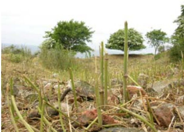
Selv bregner blev ædt